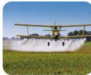
Abuso en el uso de plaguicidas químicos aplicados de forma indiscriminada.

¿De qué cultivo prefieres consumir alimentos? ¿Por qué?