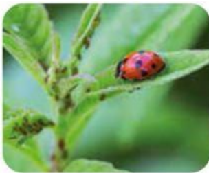
Control de plagas biológicas sin plaguicidas a través de enemigos naturales.